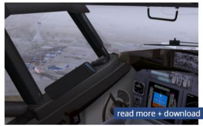
IvAO PILOT CLIENT

IvAc – Hava Trafik Kontrol Hizmeti için kullanılır.